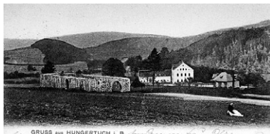
Pozdrav z Hladova v Čechách (1900) - pohled na torzo ovčince ( alte Schafstall ) u č. 92 a statek ( Hungertuchhof ) č. 93