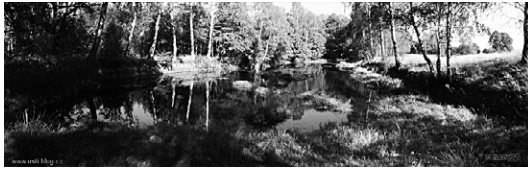
Rybniček na mlýnském náhonu ( Mühlbach )... foto: Milan 'Pekky' Bouška (léto 2007)

( Valeriana dioica ), vrba plazivá ( Salix repens ), v mezofilních a sušších štětinolístých ( Meum athamanicum ), vřes obecný ( Calluna vulgaris ), sitina kostrbatá ( Juncus squarrosus ) aj., z živočichů lze spatřit křížáka pruhovaného ( Argiope bruennichi ), chrčásta polního ( Crex crex ), bramborníčka hnědého ( Saxicola rubetra ), myšku drobnou ( Micromys minutus ), vydru říční ( Lutra lutra ) ap.